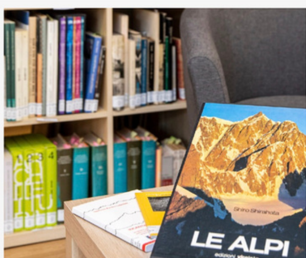
Biblioteca delle Montagne, Courmayeur, Fonte: www.courmayeurmontblanc.it

Un patrimonio di testi, immagini e audio dedicati alla montagna, digitalizzati con un sistema che consentirà di effettuare ricerche trasversali