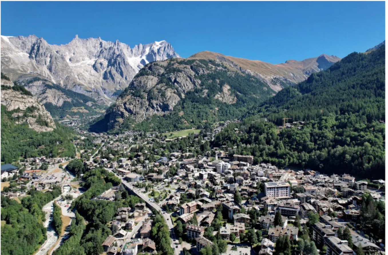
A Courmayeur nasce la “Biblioteca digitale delle Montagne”

A Courmayeur nasce la "Biblioteca digitale delle Montagne", un nuovo strumento a disposizione di ricercatori, studenti e cittadini sviluppato dalla Fondazione Courmayeur Mont Blanc. L'iniziativa fa parte del progetto Courmayeur Climate Hub, finanziato dall'Unione europea - Next Generation Eu nell'ambito del Pnrr: un percorso di sviluppo partecipato che accompagnerà la località fino al 2026.